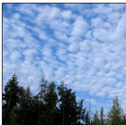
Buklesky Stratocumulus, Sc