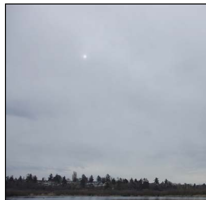
Lagsky Altostratus, As