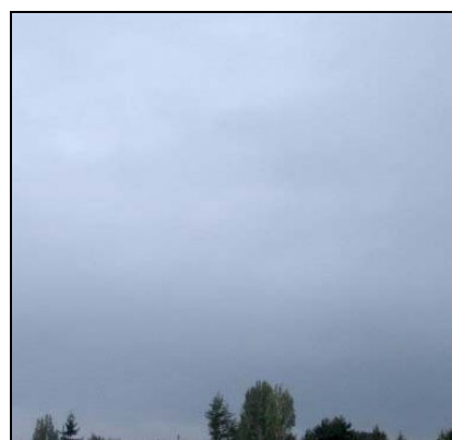
Nedbørsky Nimbostratus, Ns