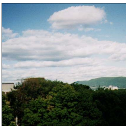
Haugsky Cumulus, Cu