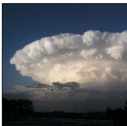
Bygesky Cumulonimbus, Cb