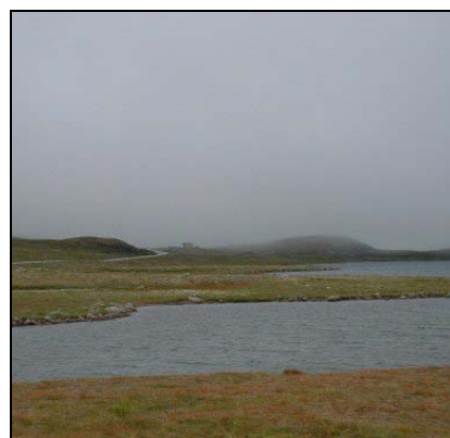
Tåkesky Stratus, St