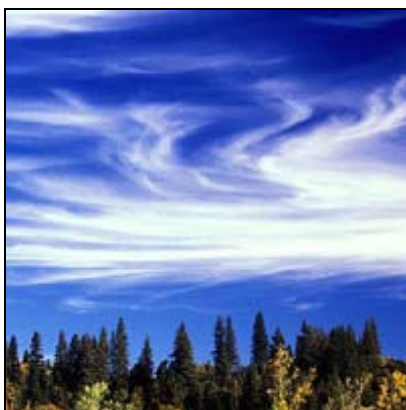
Fjærsky Cirrus, Ci